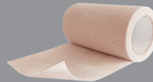
DARCO Underwrap Kohäsive elastische Unterzugbinde