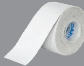
DARCO Standard Tape Unelastisches Stabilisierungstape