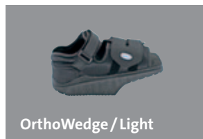
OrthoWedge / Light