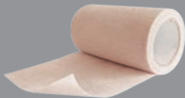
DARCO Underwrap Kohäsive Unterzugbinde