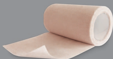
DARCO Underwrap Kohäsive Unterzugbinde