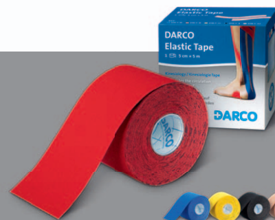
DARCO Elastic Tape Sporttape für die Kinesiologie