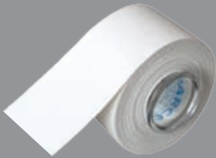
DARCO Standard Tape Unelastisches Stabilisierungstape