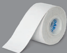
DARCO Standard Tape Unelastisches Stabilisierungstape