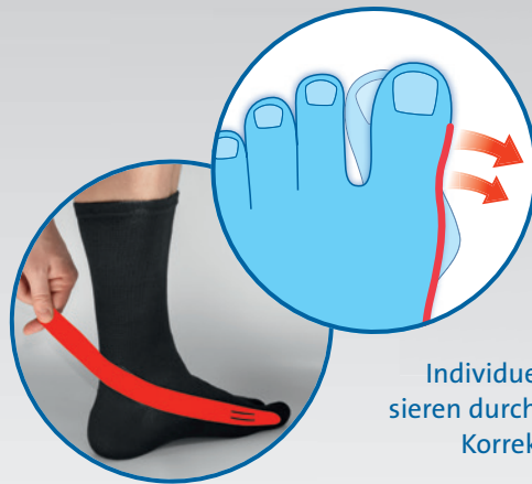
Individuelles Redressieren durch angebrachten Korrekturzügel