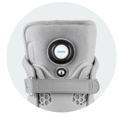
Perfekte Passform durch Luftregulierung