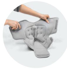
Weite Öffnung für leichten Einstieg