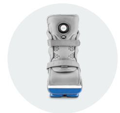
Ajustement optimal par régulation de l'air