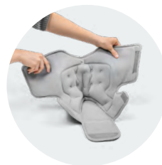
Large ouverture pour faciliter le chaussage