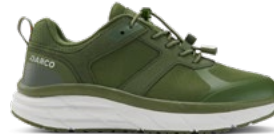
Olive | Pointures : 36 – 47