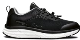
Black | Pointures : 36 – 47