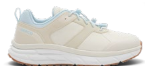
Pearl | Pointures : 36 – 47