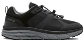
Black | Pointures : 36 – 47