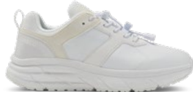
White | Pointures : 36 – 47