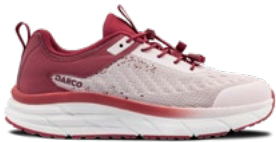
Berry | Pointures : 36 – 43