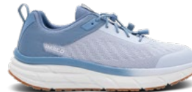
Sky | Pointures : 36 – 47