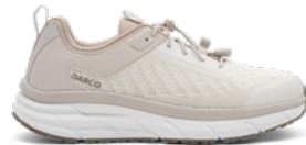
Sand | Pointures : 36 – 47