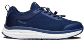
Blue | Pointures : 36 – 47