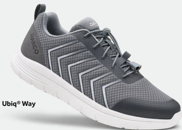
Ubiq ® Way