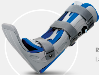
Relief Insert® 2.0 Lagerungsschiene