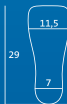
L 43,5–45 Innensohle und Zehenkappe = ML