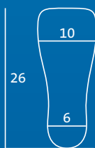
S 39–41 Innensohle und Zehenkappe = MS