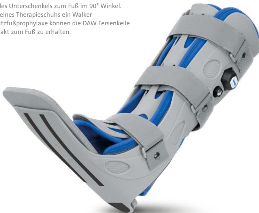
Waden-Schiene mit Waden-Liner (waschbar)