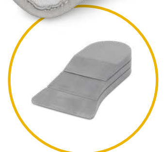
Relief Insert® 2.0 Lagerungsschiene