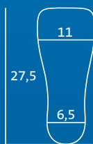
M 41,5–43 Innensohle und Zehenkappe = MM