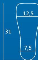
XL 45,5–47 Innensohle und Zehenkappe = MXL

Alle Maße sind in cm angegeben und entsprechen der Größe der Innensohle. Die angegebenen Schuhgrößen sind Richtwerte. Die Wahl der Schuhgröße richtet sich maßgeblich nach dem Volumen der jeweiligen Verbandsversorgung.