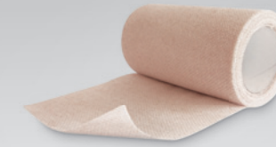
MECRON Underwrap Kohäsive elastische Unterzugbinde

Das MECRON X-patch eignet sich zur Behandlung von Schmerz- und Triggerpunkten sowie von Akupunkturbahnen. Auch Verklebungen der Faszien unter Narben werden gelöst. Das MECRON X-patch ist wasserresistent und kann mehrere Tage ohne Einschränkung getragen werden. Es besteht aus unelastischem Nylongewebe mit Acrylkleber.