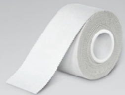
MECRON Standard Tape Unelastisches Stabilisierungstape

Das MECRON Elastic Tape Strong wurde speziell für Sportler entwickelt. Die hohe Klebkraft verhindert ein frühzeitiges Lösen vom Körper durch erhöhtes Schwitzen oder häufiges Duschen. Auch für Wassersportler ideal geeignet.