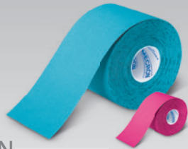
MECRON Elastic Tape Strong Elastisches Tape für die Kinesiologie

Das MECRON Elastic Tape ist ein Sport- und Therapietape. Es ist wie unsere Haut circa 30% dehnbar. Das kinesiologische Tape wird weltweit in vielen Bereichen des Sports ebenso erfolgreich eingesetzt, wie bei Patienten in physiotherapeutischer Behandlung.