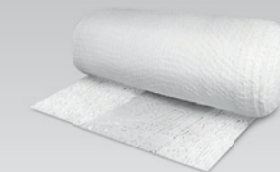
Coolaris® Elastische Zinkleim-Kühlbandage

Das MECRON Pre-Tape wird als Unterzug unter Tapeverbänden zum Schutz der Haut und zur Fixierung von Polsterbinden bei Gipsverbänden verwendet. Die dünne, blaue Schaumstoffbinde ist offenporig und zugleich wasserabweisend. Der anschmiegsame Schaumstoff ist einfach anzuwenden, sehr hautfreundlich und nimmt keine Feuchtigkeit auf.