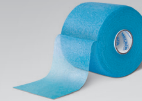
MECRON Pre-Tape Schaumstoff-Unterzugbinde

Die MECRON Underwrap ist eine längselastische, sehr dünn gewebte Binde mit selbsthaftender Eigenschaft. Die Unterzugbinde kommt bei leichter Kompressionsbehandlung wie auch zum präventiven Hautschutz zum Einsatz. Des Weiteren dient sie der Fixierung von behandlungsunterstützenden Hilfsmitteln wie zum Beispiel Eis zur Kühlung.