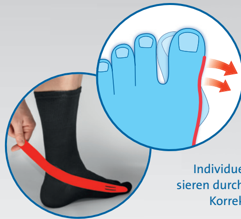
Individuelles Redressieren durch angebrachten Korrekturzügel